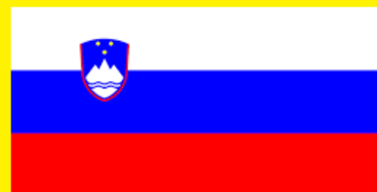
KUD Sodobnost International