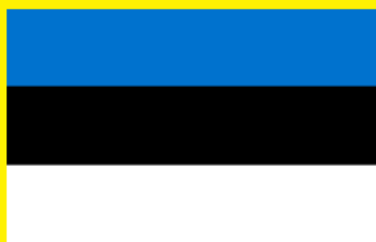
Päike ja Pilv